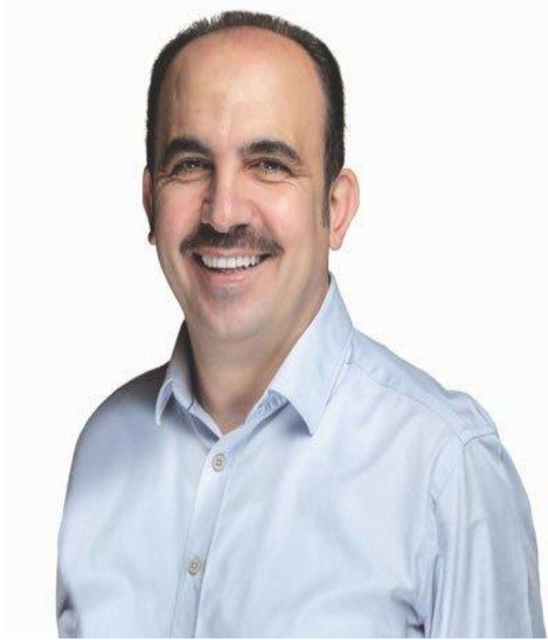
Uğur İbrahim ALYAT KONYA BÜYÜKŞEHİR BELEDİYE BAŞKANI