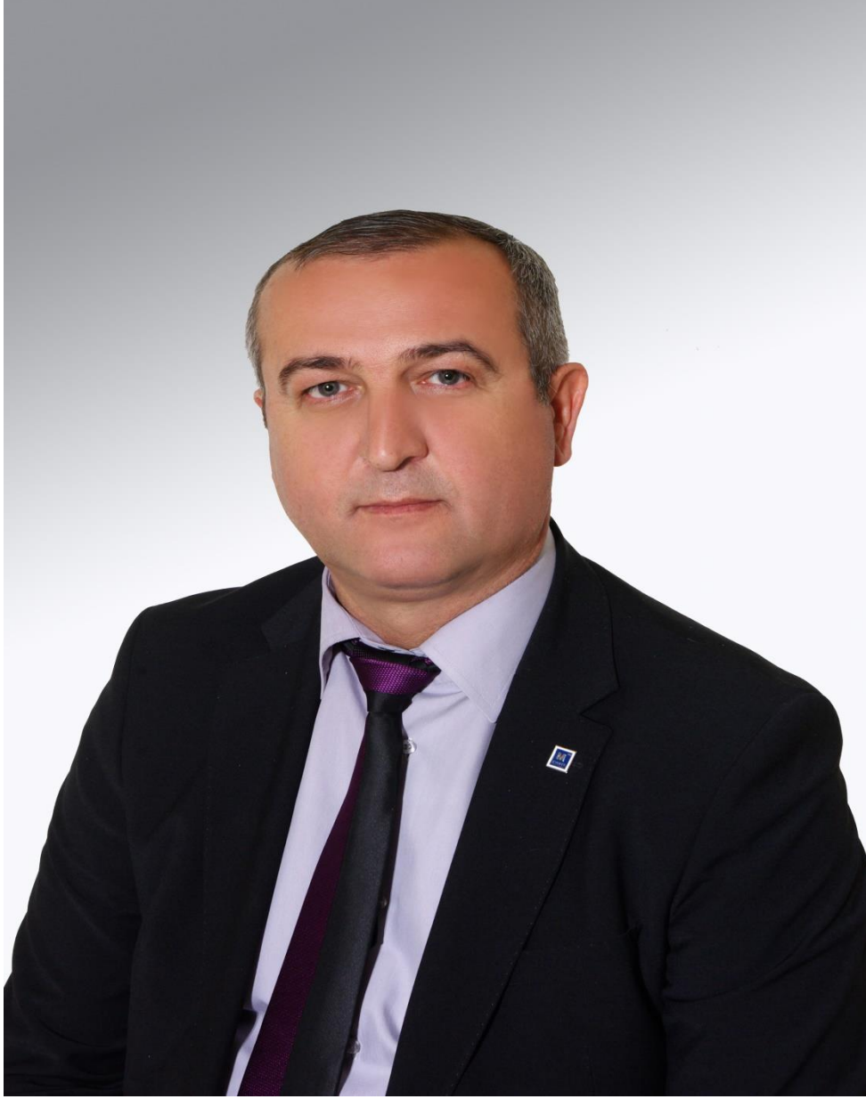
Ali KONAK YUNAK BELEDİYE BAŞKANI