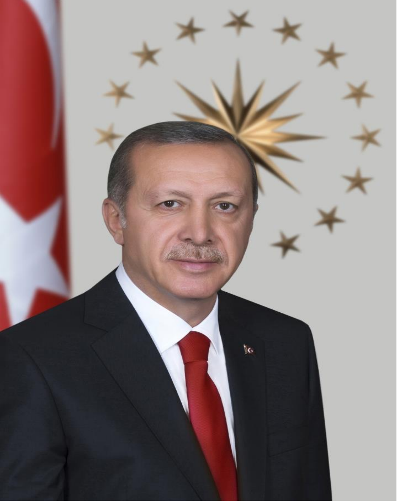
Recep Tayyip ERDOĞAN CUMHURBAŞKANI